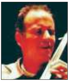
In alto i Baustelle oggi al Ministry Al centro Rino Gaetano Qui sopra Erik Friedlander